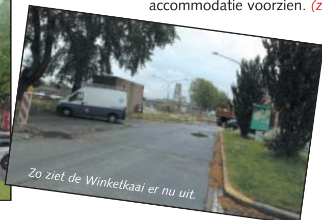
Zo ziet de Winketkaai er nu uit.

De heraanleg van de Dijleboorden wordt gestart aan de stedelijke sporthal Winketkaai. De zone achter de sporthal zal op termijn aangelegd worden als stedelijk park met aandacht voor sportinfrastructuur, ingepast in het groene kader van de Dijlevallei. Binnen deze zone wordt het nieuwe Dijlepad verbonden met het bestaande jaagpad langs de Dijle, waardoor een rechtstreekse verbinding met het Zennegat wordt bekomen. Vóór de sporthal wordt beperkte sport- en marktaccommodatie voorzien. (zie foto 1)