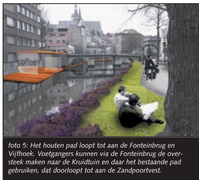
foto 5: Het houten pad loopt tot aan de Fonteinbrug en Vijfhoek. Voetgangers kunnen via de Fonteinbrug de oversteek maken naar de Kruidtuin en daar het bestaande pad gebruiken, dat doorloopt tot aan de Zandpoortvest.