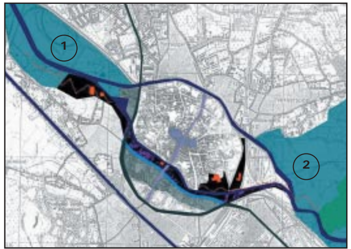
Het Dijlepad verbindt 2 groengebieden, het Blaasvelds Broek (1) en het Mechels Broek (2).

De Mechelse binnenstad heeft zeer weinig groene ruimten. Daarom wordt het Dijlepad aangelegd als een groene structuur door de binnenstad.