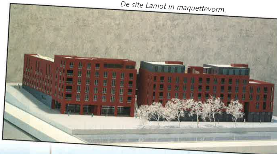
De site Lamot in maquettevorm.