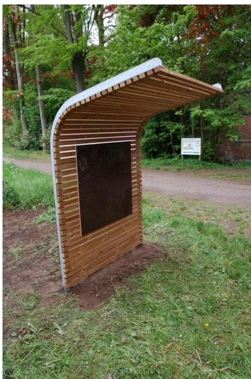
Figuur 3: Een prototype van de infowall werd aan het kasteelpark van Scheldevelde geplaatst.