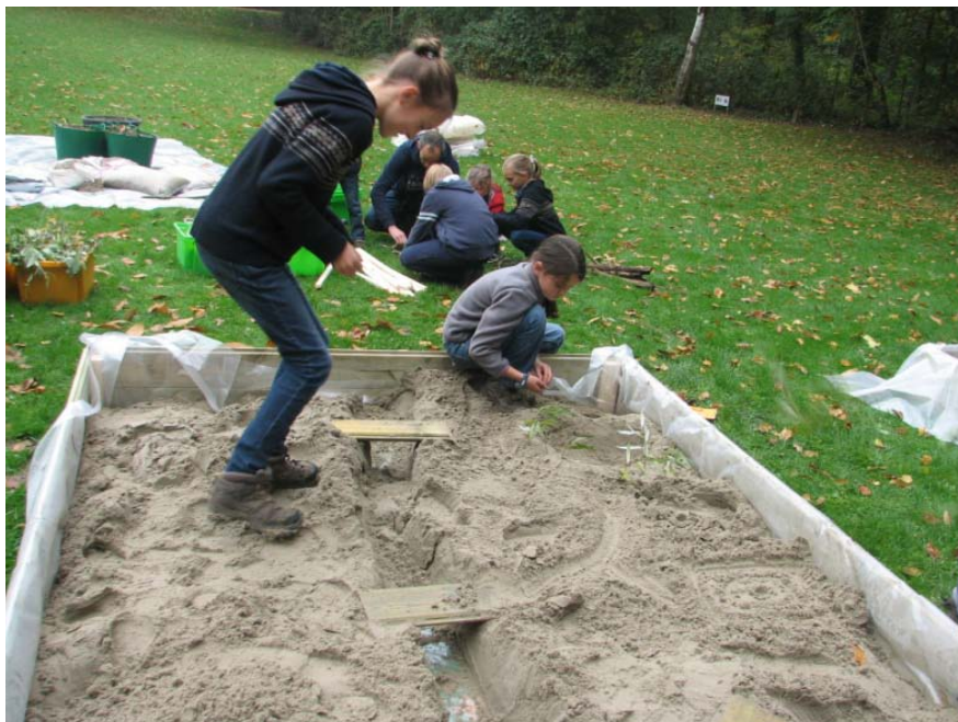
Figuur 11: In grote zandbakken knutselden de kinderen van De Pinte hun favoriete speelbos.