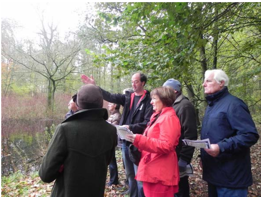
Figuur 7: Tijdens een inspraakwandeling in het Maaltebruggepark krijgen omwonenden toelichting bij het eerste ontwerp van inrichtingsplan.