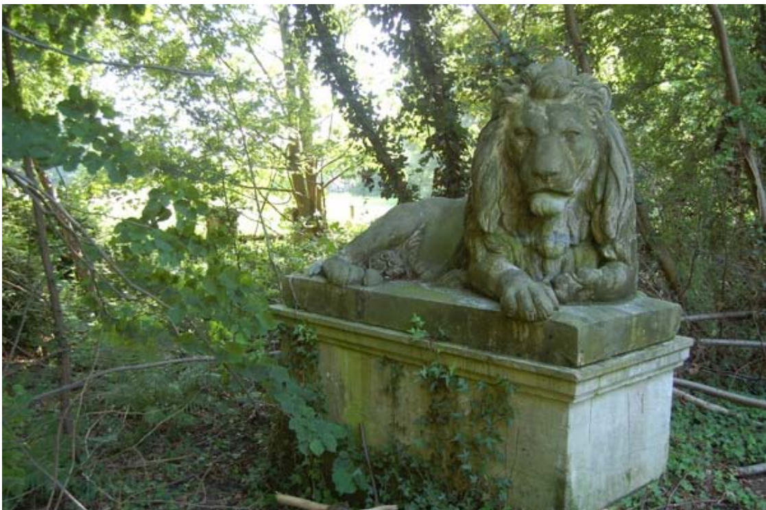
Figuur 10: Restanten van het kasteel dat in WOII verwoest werd op domein de Ghellinck.

Visievorming met de partners over verdere aanpak van dit deelproject.