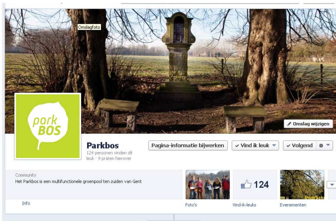
Figuur 2: De nieuwe Facebookpagina van het Parkbos