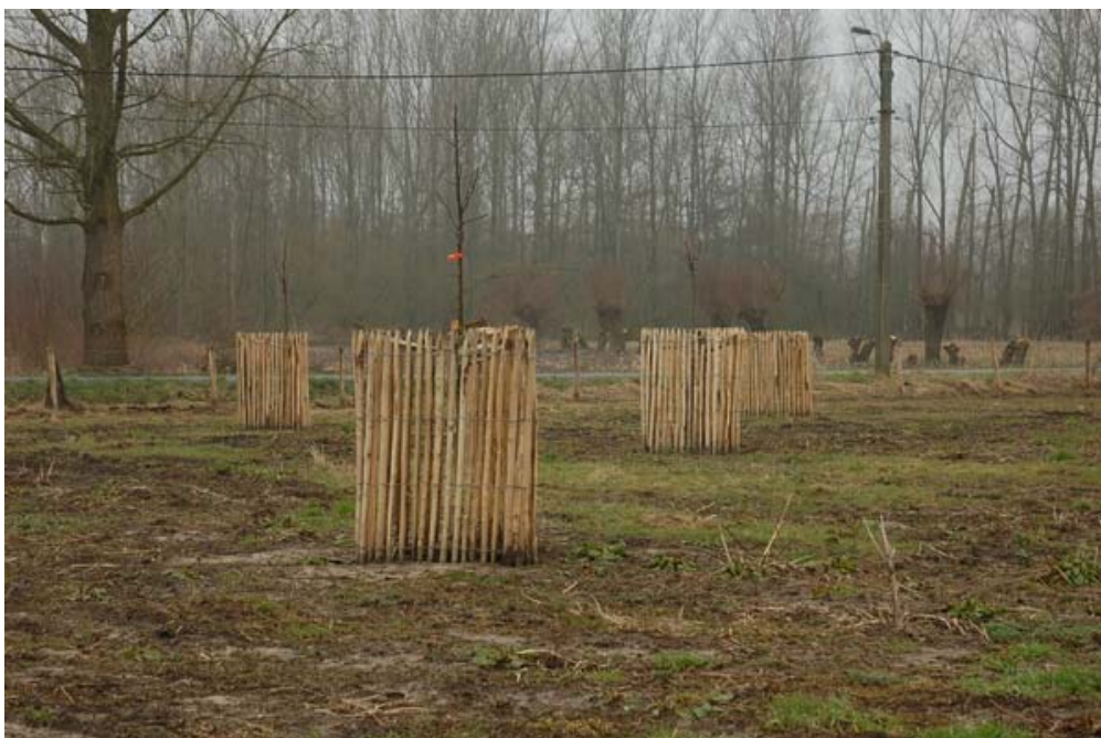
Figuur 6: In de boskern Grand Noble werd een hoogstamboomgaard aangelegd met oude fruitrassen. Soorten als Jefkespeer, Kattekop en Noordse Kriek kregen er een plaats.