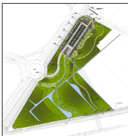
Figuur 9: het ontwerpplan voor portaal Den Beer, ten noorden van het afrittencomplex van de E17 in De Pinte.