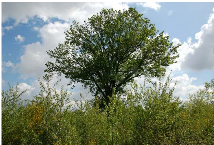
Figuur 8: Monumentale eik in portaal Grand Noble. In de nabijheid van deze boom zullen spelprikkels uitgewerkt worden.