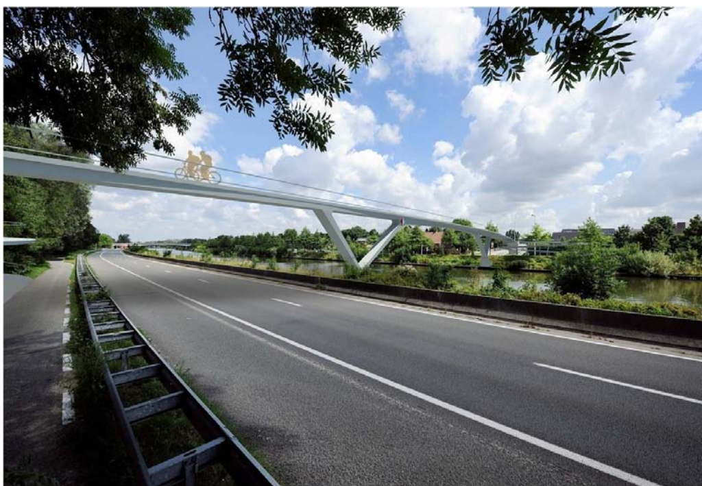
Figuur 5: de fietsersbrug over de Ringvaart/R4 zoals ingediend bij de open oproep. Dit is een ontwerp van het Luiks bureau Greisch.