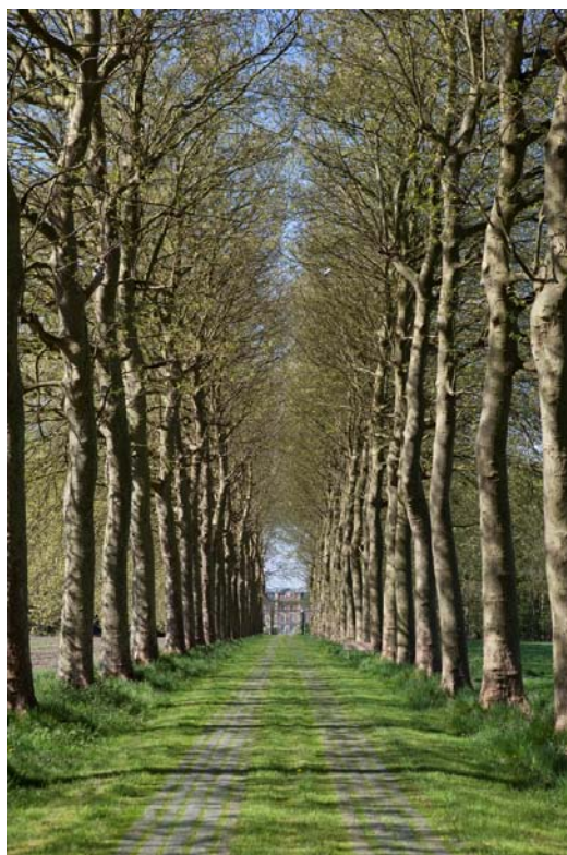
Figuur 12: het Parkbos maakt onderdeel uit van het beschermd landschap Kastelensite. Hier een van de vele kastelen in het gebied.