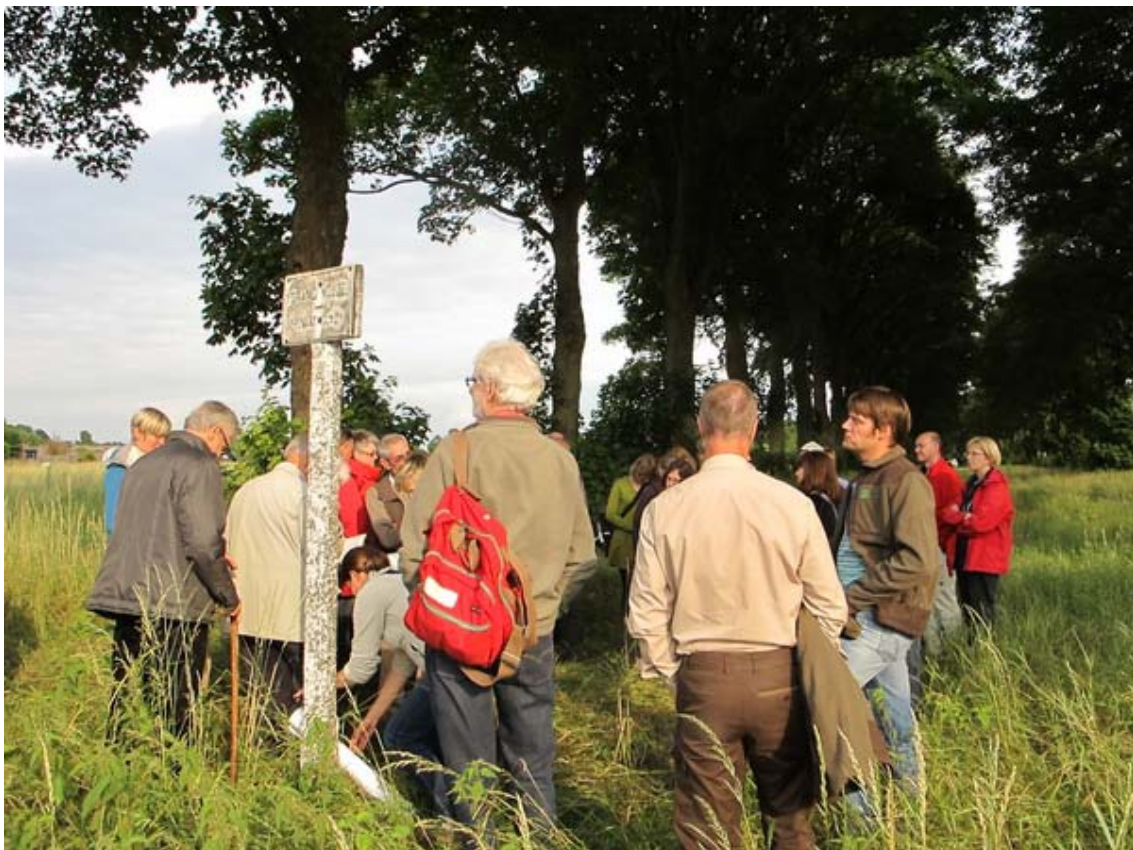
Figuur 1: Veel interesse voor de werfwandeling in boskern Grand Noble

Structuur Parkbos omzetten naar een werkbare beheerstructuur.