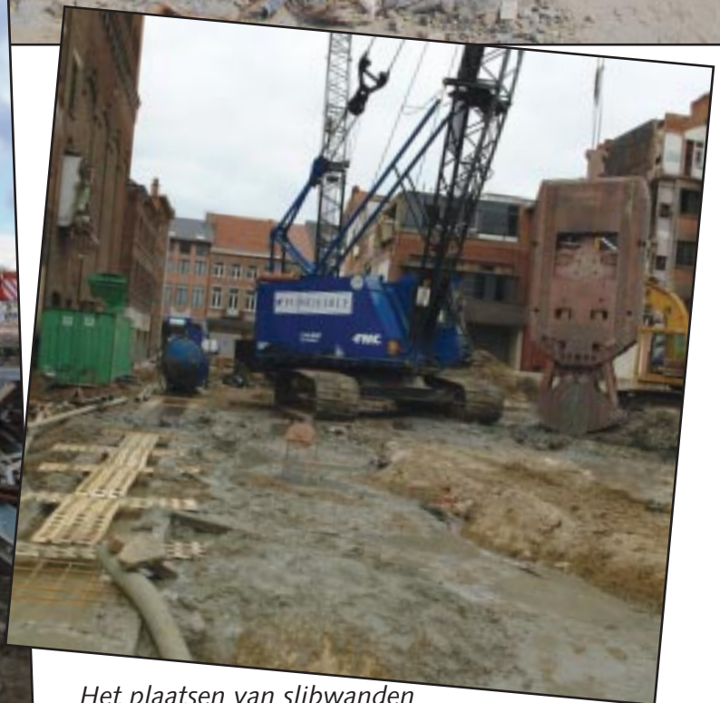
Het plaatsen van slibwanden is een zeer specifieke techniek